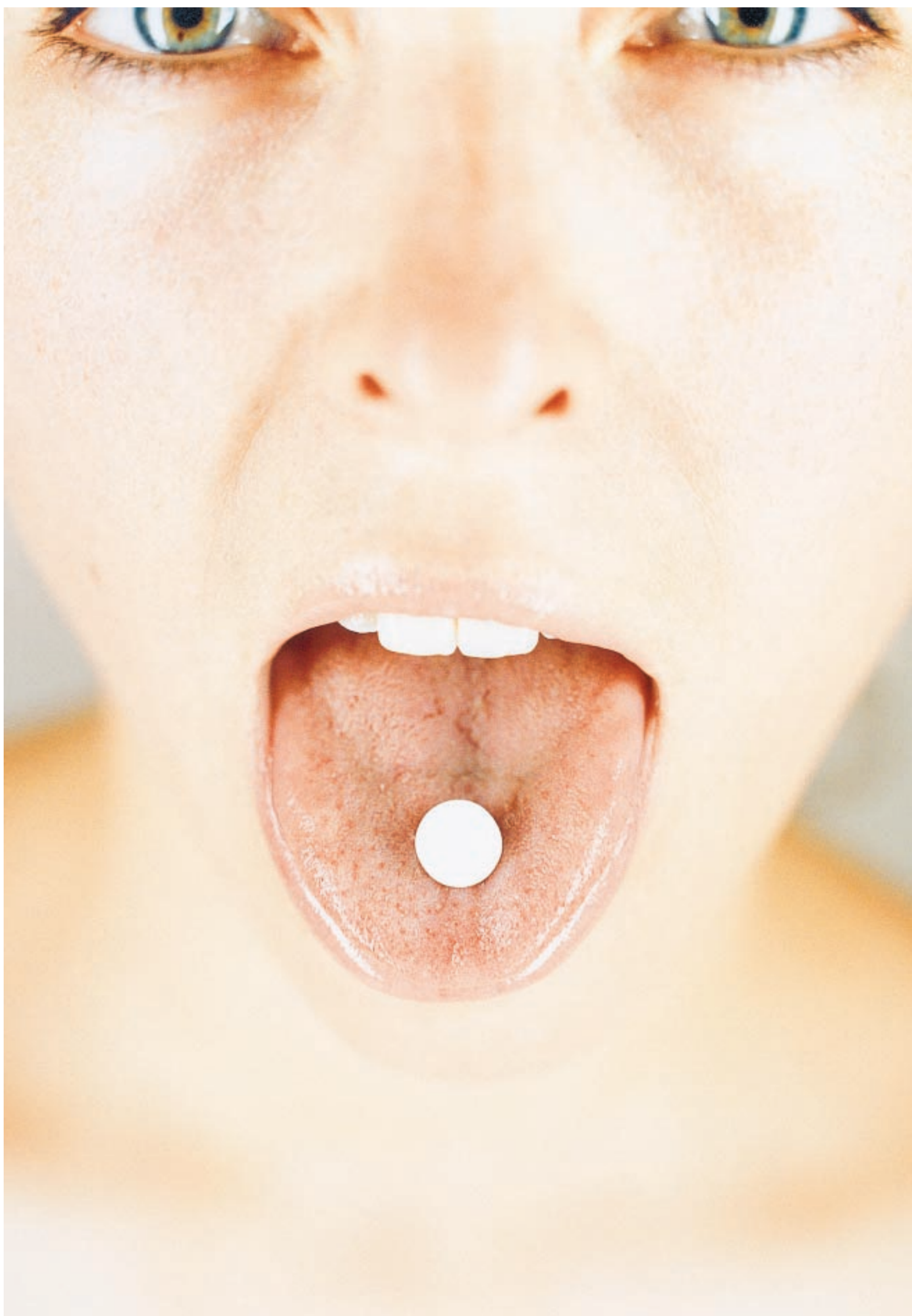
PRATEGENERATOR. Forskere i Trondheim, USA, Sveits og Israel undersøker hva som skjer når pasienter med posttraumatisk stressyndrom (PTSD) får MDMA, bedre kjent som ecstasy, under psykoterapi.